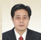
張文良 中国 人民大学教授